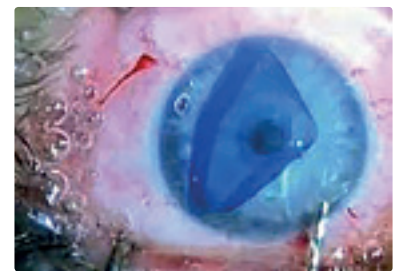
Intraoperativ, vor Entfaltung